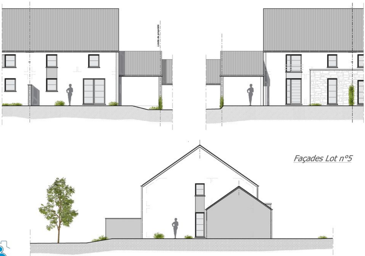
Façades Lot n°5